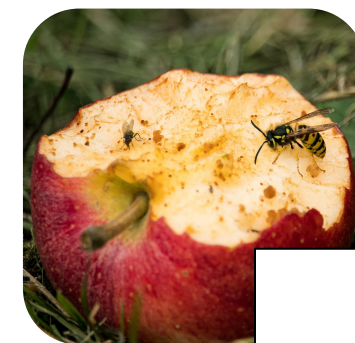
HVEPS I ÆBLE